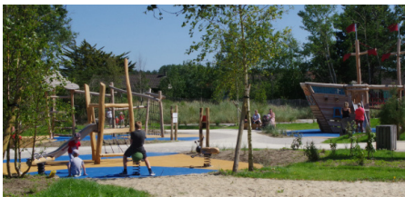
Les jeux pour enfants Parc de la Chaumière - Gratuit