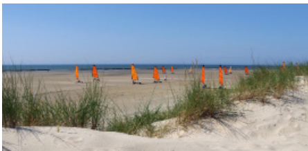
Le char à voile - +33 (0)3 21 89 60 81