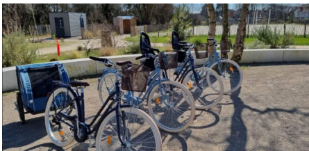
La location de vélos - Parc de la chaumière +33 (0)7 81 98 46 33