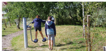
Les agrès de Fitness - Parc de la chaumière

Conception : Office de Tourisme de Camiers-Sainte-Cécile