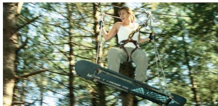
Opalaventure - Ouvert 7j/7 +33 (0)6 81 64 23 42