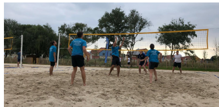
Les terrains de Beach Volley - Parc de la Chaumière - Gratuit