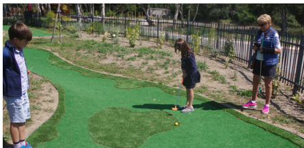
Le Mini-Golf - Parc de la Chaumière +33 (0)7 81 98 46 33