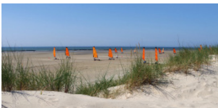
Der Segelwagen- +33 (0)3 21 89 60 81