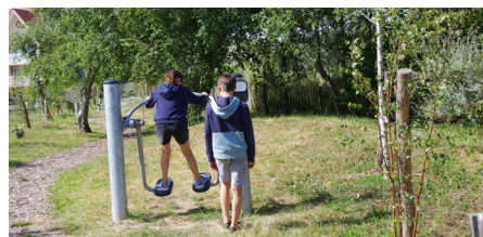
Les agrès de Fitness-Parc de la chaumière

Conception : Office de Tourisme de Camiers-Sainte-Cécile