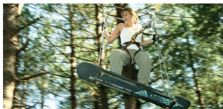
Opalaventure - geöffnet 7j/7 +33 (0)6 81 64 23 42