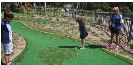
Mini-Golf - Parc de la Chaumière +33 (0)7 81 98 46 33