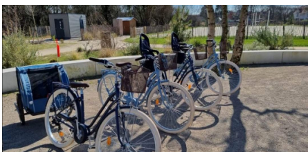
Vélovermietung - Parc de la chaumière +33 (0)7 81 98 46 33